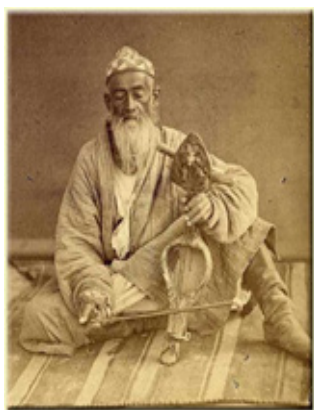
Сурет 1. Каузчи Түркістан альбомы (1871-1872)