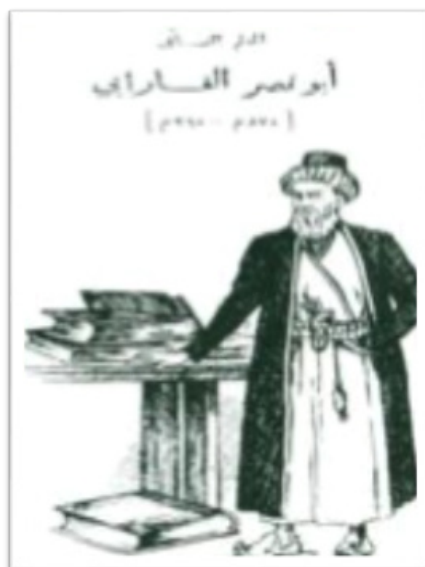
2 сурет. Әбу Насыр әл-Фарабидің өз замандасы салған суреті (Ақжан Машанов тапқан)

3. Әли Юхан ибн Хайланнан да логика саласынан дәріс алады.