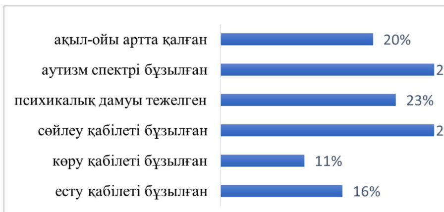
3-сурет. Мүмкіндіктері шектеулі балалармен жұмыс істеу нәтижелер

санаты болды?» деген сұраққа педагог өзінің педагогикалық тәжірибесінде ерекше балалармен жұмыс барысында кездесті. Барлық 80 педагог өз тәжірибесінде 28% сөйлеу қабілеті мен психикалық дамуы тежелген балалармен жұмыс жасаған (сөйлеудің жалпы дамымауы, тұтығу, дыбысты айту проблемалары). Педагогикалық қызмет барысында тірек-қимыл аппараты бұзылған балалармен, көру және есту қабілеті бұзылған, аутизм спектрі бұзылған балалармен жұмыс істегендерін растайды. Педагогикалық іс-әрекеттің әртүрлі аспектілерін өзін-өзі бағалау арқылы мұғалімдер өздерінің қиындықтарының дәрежесі анықталды (жоғары, орташа, төмен).