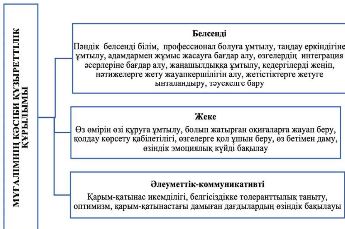
Сурет 1. Мұғалімнің кәсіби құзыреттілік құрылымы

Мұның барлығы маңызды және қажетті, алайда мұғалім қызметіне қойылатын заманауи талаптар үнемі өзгеріп отырады, мысалы, негізгі кәсіби қасиеттер білім алу болып табылады, себебі, үнемі өзгеріп отыратын әлем білім беру мен тұлғаның дамуына үлкен септігін тигізеді. Жалпы, жоғары оқу орын өмір бойғы білімді бере алмайды. Адам өзі оқу аяқталғаннан соң, білім алу процесін әрі қарай жалғастыру керек. Еуропалық деңгейдегі өмір бойы білім алудағы негізгі құзыреттіліктер барлық адамзат баласының белсенді азаматтық позицияларына, жұмысқа орналасу және сәтті әлеуметтік интеграция, сонымен қатар жалпы өзіндік даму үшін қажет. Білім алуды жалғастыру және оны сақтау, уақыт пен ақпараттарды тиімді басқару негізінде жеке білім алуды ұйымдастыру мақсатында «үйрену қабілеті» жетекші құзыреттілік болып табылады. Шет елдік зерттеулердің негізінде болашақ бастауыш сынып мұғалімінің кәсіби дайындығын дамытудағы басқа да маңызды құзыреттіліктерді атап көрсетуге болады.