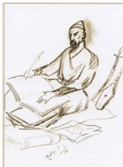
Исмаилов А. Эскиз к образу аль-Фараби