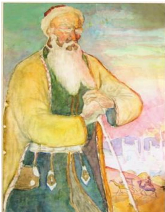
Исмаилов А. Последние годы жизни аль-Фараби

в старости. А. Исмаилов пишет образ аль-Фараби по дороге на его родину, в Отырар.