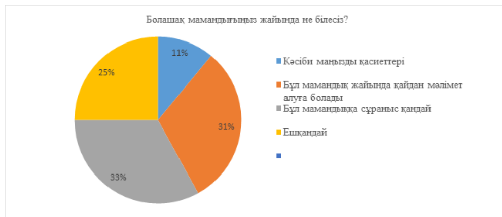
4-сурет. Сұрақ бойынша сауалнама нәтижелері

Жоғары оқу орнына дейінгі тиімді дайындықты ұйымдастыруға арналған зерттеулер нәтижесінде: «Болашақ мамандығыңыз жайында не білесіз? (егер мамандық тандасаңыз, жауап беріңіз)».