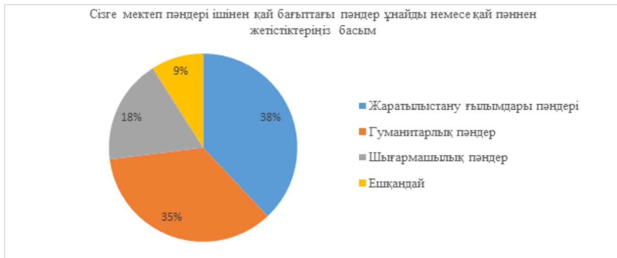
5-сурет. Сұрақ бойынша сауалнама нәтижелері

«Сізге мектеп пәндері ішінен қай бағыттағы пәндер қатты ұнайды немесе қай пәннен жетістіктеріңіз басым (бірнеше пәндерді белгілеуіңізге болады)»