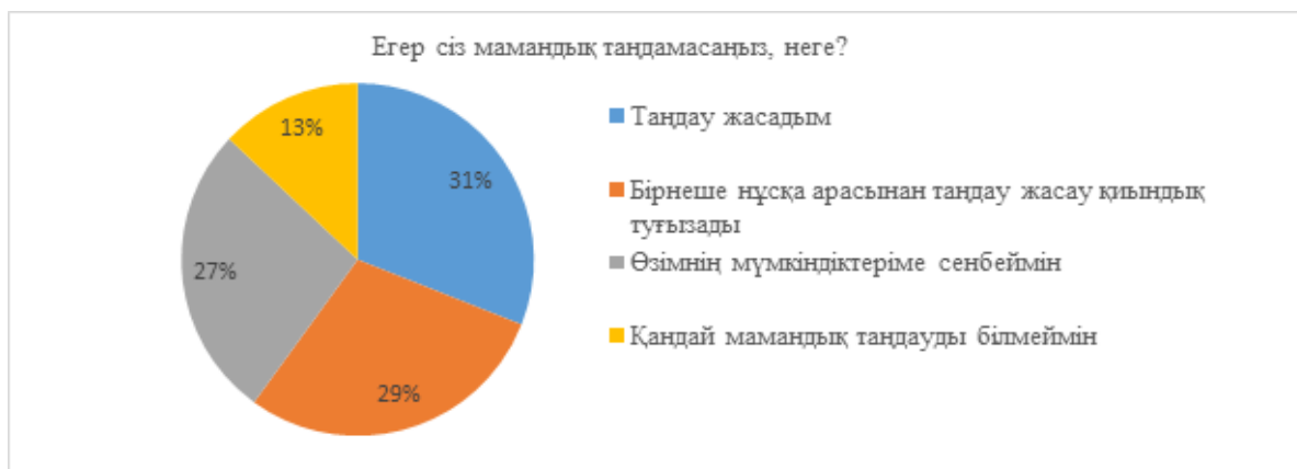
3-сурет. Сұрақ бойынша сауалнама нәтижелері

«Егер сіз мамандық таңдамасаңыз, неге? (егер сіз мамандық таңдамасаңыз, жауап беріңіз)» деген сұрақ бойынша сауалнама нәтижесі жүргізілді (3-сурет).