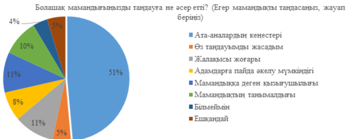
2-сурет. Сұрақ бойынша сауалнама нәтижелері

Сауалнама нәтижесі бойынша «Қазіргі сәтте болашақ мамандығыңызды таңдадыңыз ба?» деген сұраққа сауалнамаға қатысқан өртүрлі аңғарымдары бар барлық мүмкіндігі шектеулі балалар белсене қатысты (2-сурет).