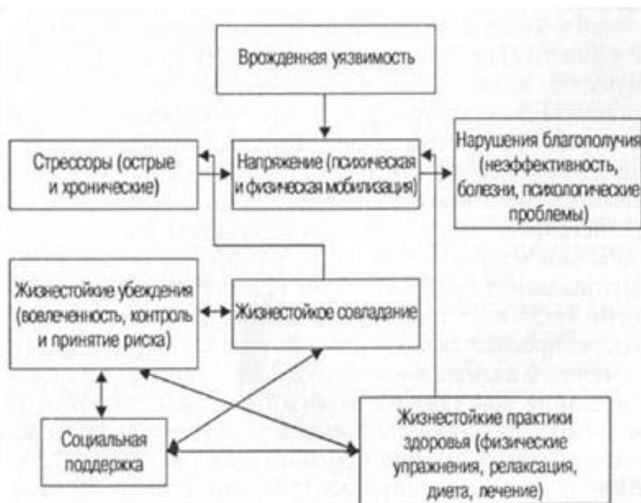
Рисунок 1. Модель развития жизнестойкости С.Мадди

Данная концепция выступает в качестве основной нашего теоретико-эмпирического исследования динамики развития жизнестойкости у будущих педагогов и психологов. Феномен «жизнестойкости» в российской психологии рассматривали как интегральную характеристику личности, отражающую способность преодоления трудных жизненных ситуаций, которая предполагает адаптированность, стрессоустойчивость, саморегуляцию, психологическую устойчивость и раскрытие потенциала личности в целом. А.Н.Фомина отмечает, что «жизнестойкость», помимо вышеперечисленных компонентов, включает в себя такие базовые ценности, как кооперация, доверие и креативность. Высокий уровень жизнестойкости способствует оценкесобытий, как менее травмирующих, и успешному совладению со стрессом [7, С.24].